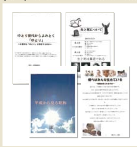
【図表2】成果発表のために学生が作成した資料

※7つのテーマを虹の7色に例え、7色の頭文字「VIBGYOR」をクラス編成に用いている。それぞれの頭文字（色）に5つずつクラスがあり、その5クラス単位でテーマを渡り歩いていく。したがって学ぶ時期は、どの頭文字（色）に属するかによって異なる。上記はVクラスの場合の例。